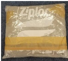
完成したクッション