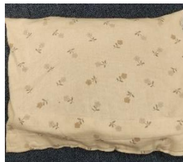
カバーありクッション